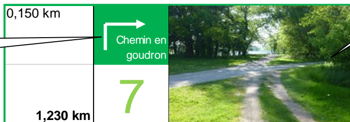
Photo de l'endroit où vous trouvez

Direction à suivre pour aller jusqu'à la prochaine photo