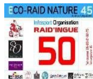
Dossard 2021 – raid'ingue